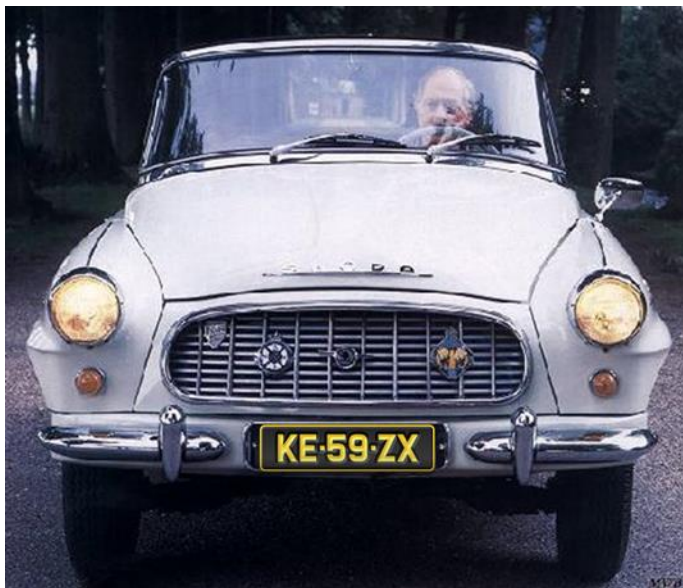
Retro RZ pre historické vozidlá; bývalý okres „KE“ Košice-mesto (1960 – 1992); rok výroby 1959