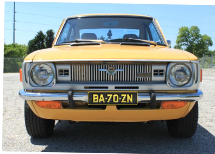
Retro RZ pre historické vozidlá; bývalý okres „BA“ Bratislava-mesto (1960 – 1992); rok výroby 1970