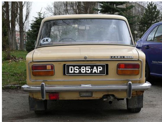
Retro RZ pre vozidlá s rokom výroby pred 1993; bývalý okres „DS“ Dunajská Streda (1960 – 1992); rok výroby 1985