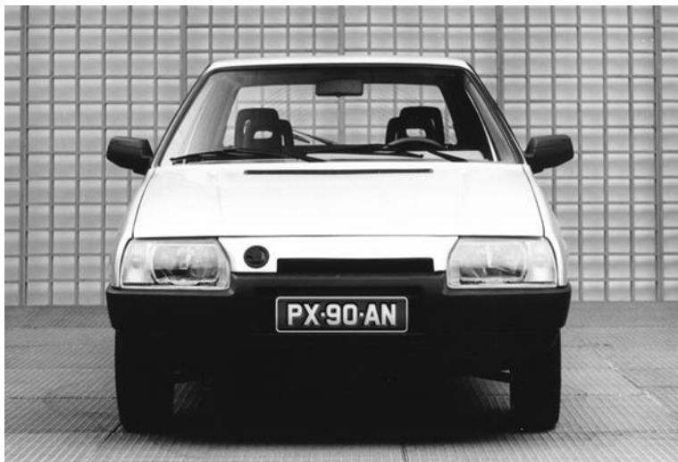
Retro RZ pre vozidlá s rokom výroby pred 1993; bývalý okres „PX“ Považská Bystrica (1960 – 1992); rok výroby 1990